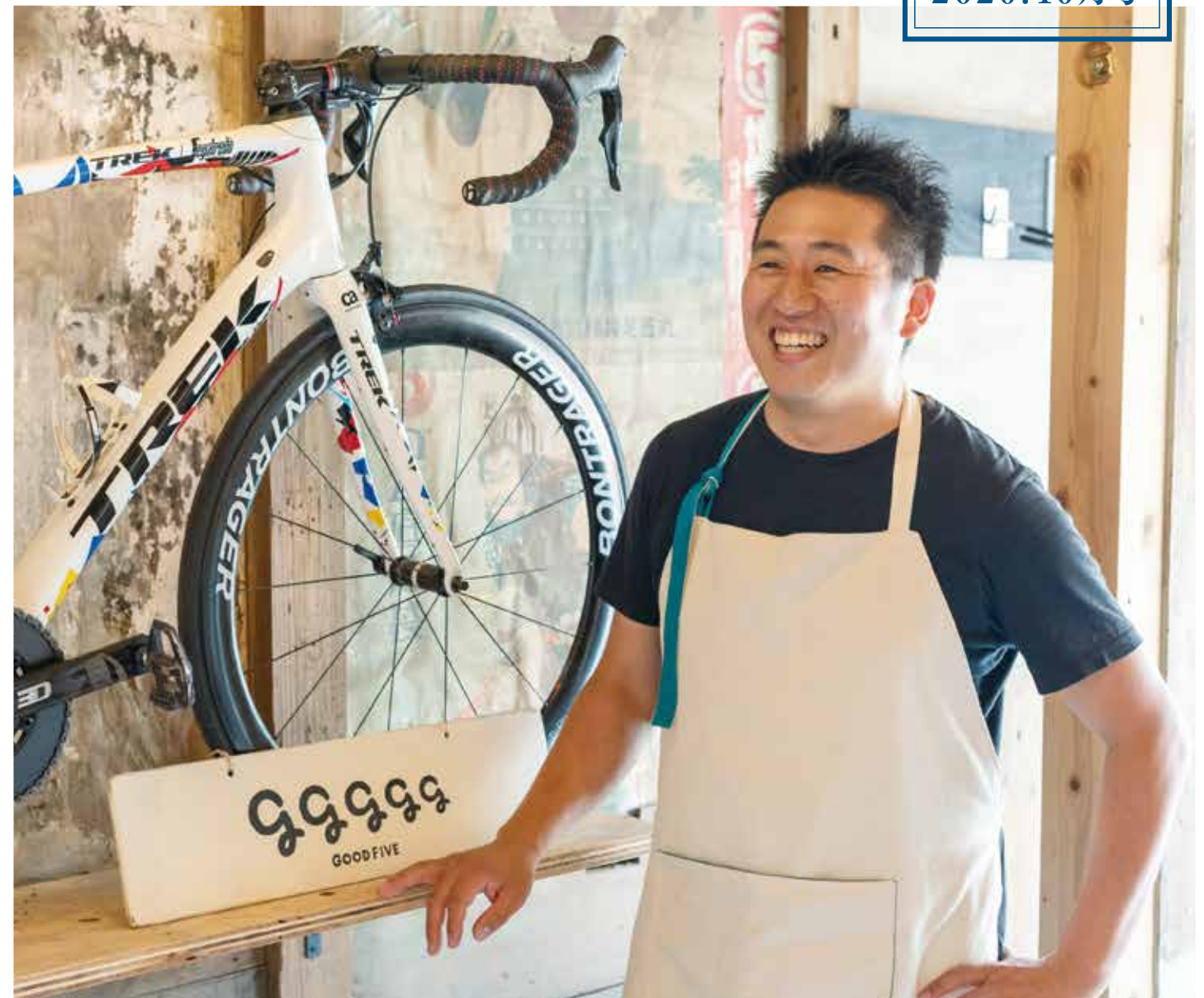
プロフィール：神奈川県川崎市出身。日本大学建築学科卒。工務店やスポーツバイク店(BEX ISOYA)勤務を経て、2017年、いの町で地域おこし協力隊員に。2019年、スポーツバイク観光と中心市街地振興の拠点となるカフェをオープン。

gが元気よく5つ並ぶロゴが目印。大園さま近くの築110年になる町屋を改装した、スポーツバイク(自転車)とカフェの空間「グッドファイブ」へようこそ。