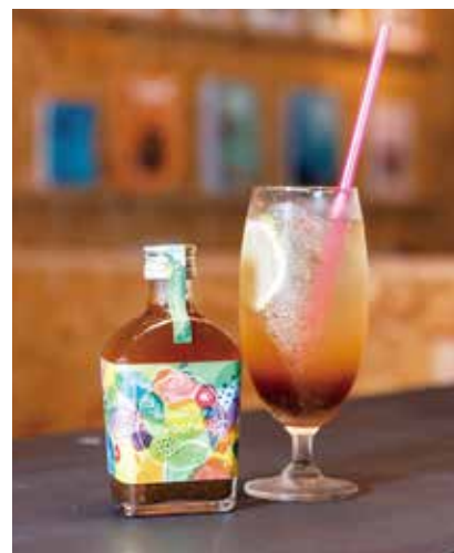
生産者やクリエイターと組んで開発した生コーラ、Sawachina(サワチナ)。いの町産有機生姜や柑橘類、和ハーブを使用。

自転車イベントのプロデューサー。出身地の川崎市では老舗スポーツバイク店の店長を7年経験し、お客さんに関東各地へ自転車ツアーに連れて行っていました。だからこそ、仁淀川流域サイクリングの環境的な魅力も、しっかり発信できるのです。