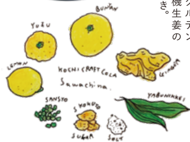
コーラの素材も関わる人もオール高知。